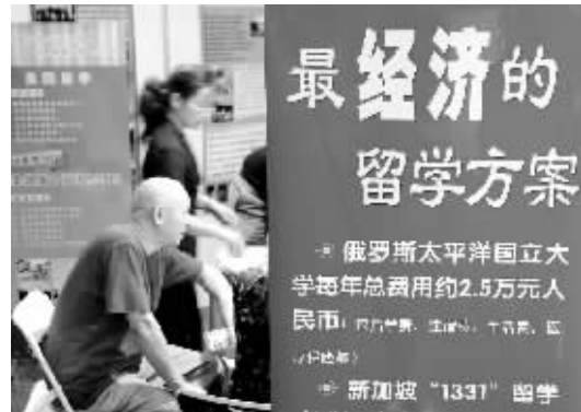
高考结束后,留学中介开始活跃起来。

现自己的理想,进行了最艰巨的一搏,对近视的应届高考学生,现推出优惠活动,凭准考证手术费优惠600元,同时享受其他优惠。”这是郑州一家医院推出的活动。