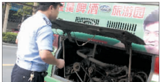
民警踮着脚尖看公交车车号。