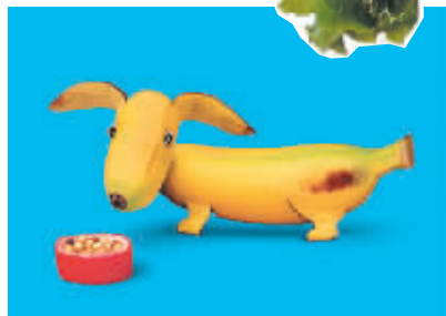
香蕉小狗：“先偷吃一点再说。”