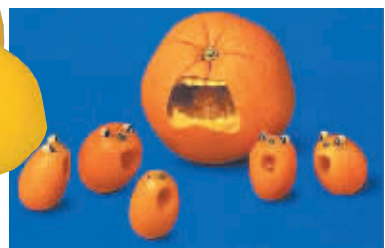
橘子家族：“快开饭，饿死了！”