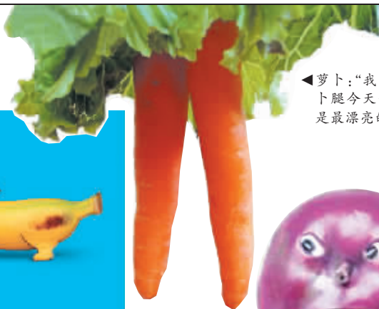
萝卜：“我的萝卜腿今天一定是最漂亮的。”