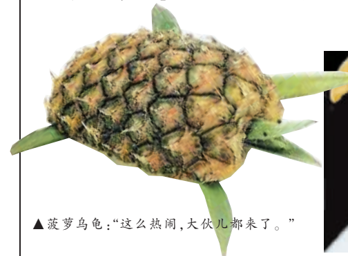
菠萝乌龟：“这么热闹，大伙儿都来了。”