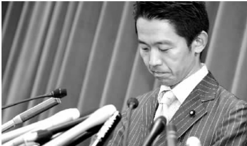
8月1日,日本农林水产大臣赤城德彦在东京宣布辞职。

新华社供本报特稿 身受虚报办公费丑闻困扰的日本农林水产大臣赤城德彦8月1日宣布辞职,称此举是为执政党自由民主党在参议院