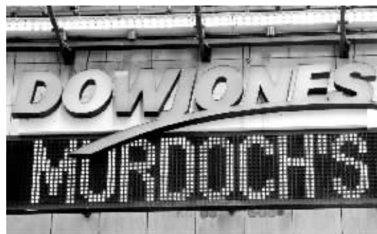
今年5月1日,默多克新闻集团竞购道琼斯的新闻字幕从纽约时报广场的道琼斯公司标志下滚动发布。

街日报》,其全球发行量超过1900万份。该公司同时还拥有道琼斯有线新闻社、《远东经济评论》等著名财经媒体。