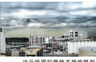
这云低得好像伸手就能够到。