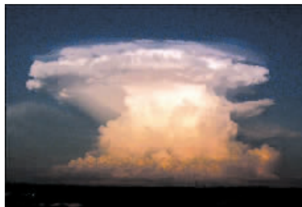
这才是真正的蘑菇云。