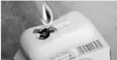
把牙刷点着，开始滴塑料蜡油