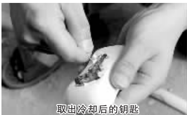
取出冷却后的钥匙