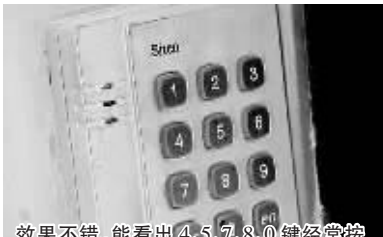
效果不错，能看出4、5、7、8、0键经常按