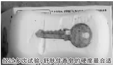
经过多次试验，舒肤佳香皂的硬度最合适