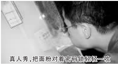
真人秀，把面粉对着密码锁轻轻一吹