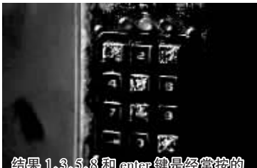
结果1、3、5、8和enter键是经常按的