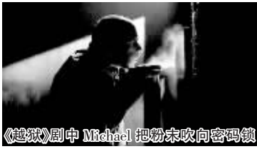
《越狱》剧中 Michael把粉末吹向密码锁