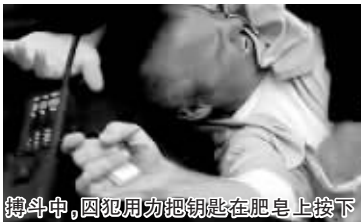
搏斗中，囚犯用力把钥匙在肥皂上按下