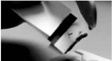
用打火机烧化牙刷把制作钥匙