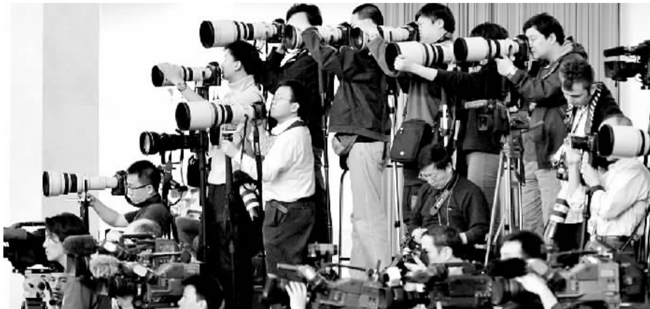
西藏问题是今年记者招待会的热点