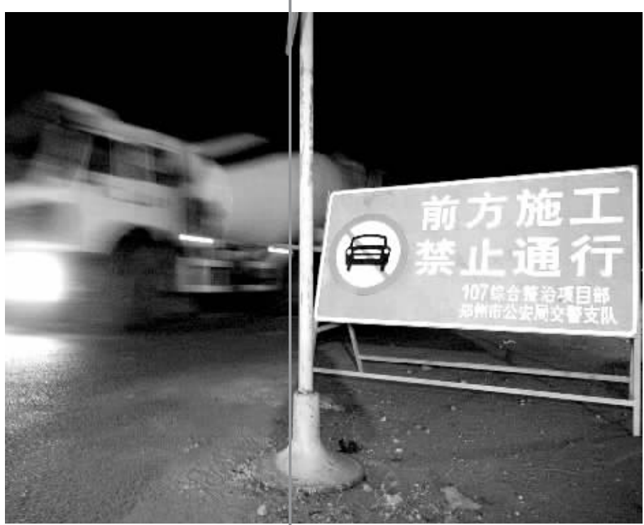
昨天晚上，已有车辆在临时通道“捷足先登”。

该临时通道设计为双向四车道，交警支队将在以上分流路段的路口设置交通信号灯和交通标志，施划交通标线，并派民警在路口疏导执勤。