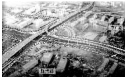
陇海路—京广路立交桥

规划中的陇海快速路采用全程高架式:从西三环开始向东起坡高架,途中跨京广北路,跨过两条铁路,经过一马路、紫荆山路、未来路向南接货站街最终向东接入中州大道,全长13.5公里,道路红线由50-60米不等。