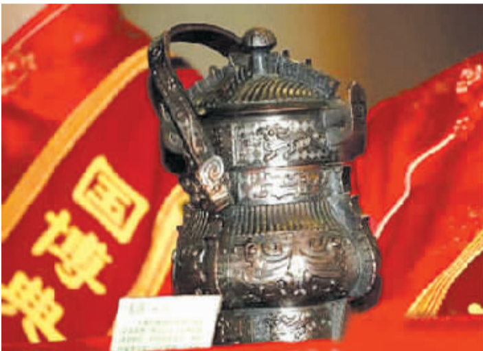
茅台仿古青铜酒器——戈卣(音:you,古代盛酒器具,口小腹大) 资料图片

在2007年底举行的国酒茅台慈善拍卖会上,茅台集团捐出绝版珍藏的1957年产茅台酒一瓶、1966年产茅台酒一瓶,以及编号为1880的1997年香港回归纪念酒一瓶进行慈善拍卖。