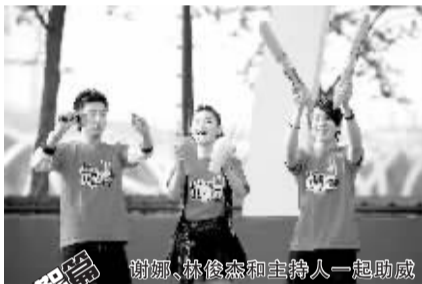
谢娜、林俊杰和主持人一起助威

昨天下午在国家奥体中心，来自北京体育大学的1200余名参与全国招募计划的奥运会支持者和热心观众汇集一堂，在麦当劳奥运助威团全国五强代表的带领下，用整齐划一的舞蹈为北京2008年奥运会加油助威。长达5分钟振奋人心的表演挑战了世界吉尼斯纪录史上的拉拉队助威舞蹈人数之最，现场的激情令人震撼。自2007年12月起启动了“奥运助威团”全国招募计划，活动吸引了超过100万人的积极报名参与。通过层层选拔和培训，最终有5名幸运儿脱颖而出，他们将亲临北京2008年奥运会赛场为中国运动员加油助威。