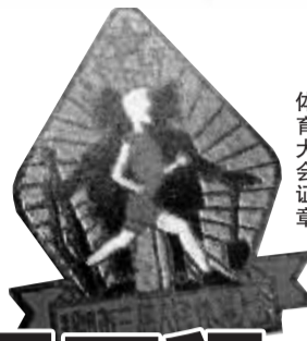
郑州市第三届人民体育大会奖章