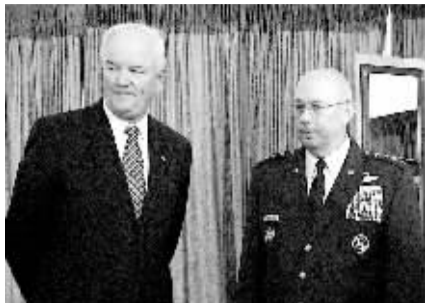
2006 年 10 月 14 日, 迈克尔·温(左)和迈克尔·莫斯利在弗吉尼亚州。

据新华社特稿 美国国防部长罗伯特·盖茨 5 日宣布, 解除美国空军最高文职和军职两名高层的职务。盖茨说, 以往几次“意外”显示, 空军在核武器管理方面存在漏洞。