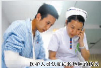
医护人员认真细致地照顾伤员

从组建医疗队赴灾区救援、多次组织全院范围的募捐,到被确定为接治伤员的定点医院、派出医护人员前往四川接伤员、腾出新病房楼的一个楼层、成立专家治疗组尽心尽力救治灾区伤员,在汶川大地震中,郑州市五院全程参与了抗震救灾工作,出色的表现充分彰显了河南人民对灾区的骨肉之情、大爱之心。