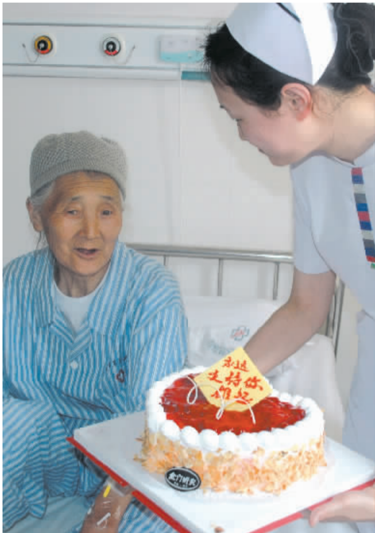
医护人员为灾区伤员过生日

由于距地震发生的时间越来越长,加之天气变热,挖出的尸体开始腐烂,消毒工作非常艰巨,但所有医务人员都毫无怨言。路上饿了,救援队员就啃几口随身携带的干粮;累了,他们也舍不得休息,擦干头上的汗珠再奔向下一个村