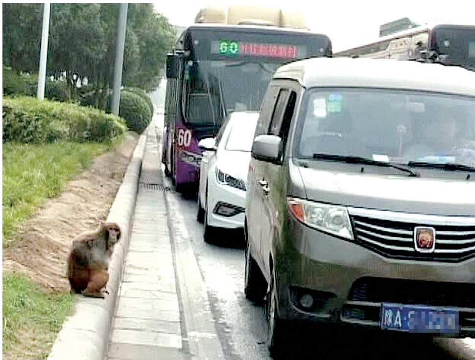
路边“等车”,猴在旅途