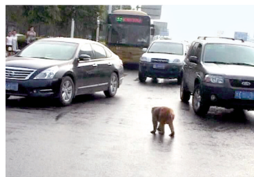
目无交规,闲庭信步