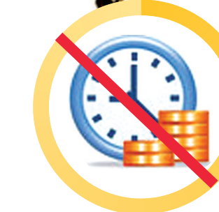
取消超限费,并规定发卡机构不得对服务费用计收利息。