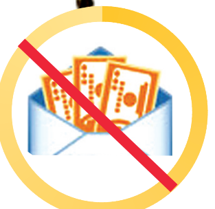
取消滞纳金,由发卡机构与持卡人协议约定违约金。