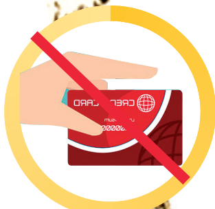
取消关于透支消费免息还款期最长期限、最低还款额标准以及附加条件的现行规定。

有业内人士表示,本次央行针对信用卡业务推出新规,与信用卡业务在我国消费市场上占据极为重要作用密切相关。随着信用卡发卡量越来越大,信用卡使用情况却和现有规定并非相匹配。因此,现在的消费环境下,信用卡改革有着必要性。