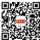
郑州晚报 公益平台官微