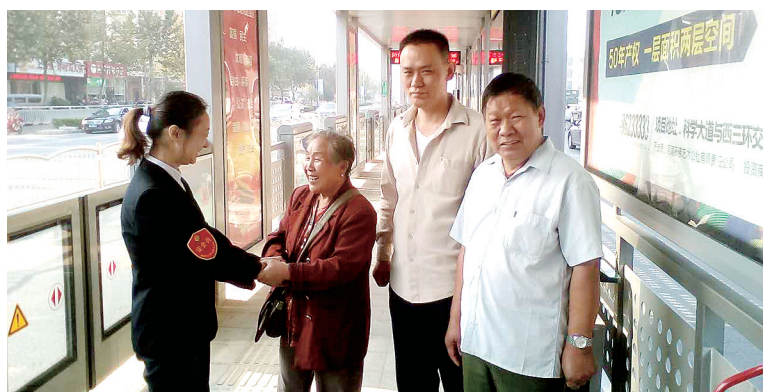
迷路老人的家人感谢公交站务人员

本报讯 67岁老人遛弯迷路走了一夜,从荥阳人民广场来到了电厂路上的BRT站台。热心站务长发现后找到老人携带的联系卡片,帮助老人一家在站台内实现团圆。