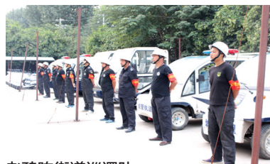
老鸦陈街道巡逻队

老鸦陈街道进一步加大大气污染防治投入力度,对大气污染巡查交通工具进行更新配备。此次街道共购买环保排查电动车40辆,还为执法巡查队配备了四座巡查电动车4辆,八座巡查电动车1辆,十一座巡查电动车1辆,电动牵引载货车2辆,此次巡查交通工具的更新街道共投入资金60万元,目前配备车辆已全部投入使用。 通讯员 贾雅丽