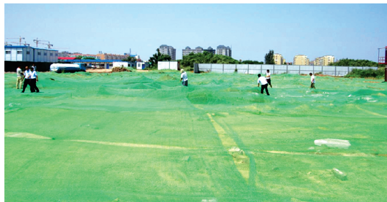
迎宾路街道正在覆盖防尘网

一是凝心聚力,明确分工。迎宾路街道成立由党委书记任组长,主管副职任副组长的监察组,坚持全员出动,由各包村(社区)科级干部带领三级网格长和小组成员,每日深入各村(社区)进行排查,由班子成员、部门负责人、三级网格长逐级负责,做到全面覆盖,不留死角。