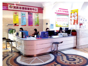
彩虹社区服务中心

坚持目标导向和问题导向,推进精神文明创建工作“常态化、长效化”发展,是近期下发有关惠济区的全国文明城市创建工作内容的文件精神和要求。为确保创文工作顺利推进,区委办、政府办调整组建了新的创建全国文明城市领导小组,将精神文明创建作为落实“两手抓、两手都要硬”战略方针、推动城市物质文明和精神文明协调发展的重要载体,摆上党委政府工作重要位置;同时强化督查制度,党委政府分别成立了创建全国文明城市工作专项督导组,并在全区镇(街道)实施创建全国文明城市工作互查互评,把各个部门、社会各界、广大市民的力量调动起来,注重创建过程、提升质量水平,保持创建经常化,持之以恒推进创建全国文明城市工作。