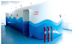
大型多人高压氧舱

你见过高压氧舱吗?一个巨大的白色封闭圆筒,用于治疗各种缺氧症。在郑州市二院,大家都亲切地叫它“大白”。