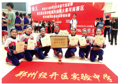
河南省健美操比赛个人优秀奖

10月17日中午,经开区实验中学全体教师以各科室为组,开展了主题为“我运动,我健康,我快乐”的教师团体操展示活动。