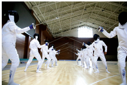
校击剑队被评为河南省优秀击剑队