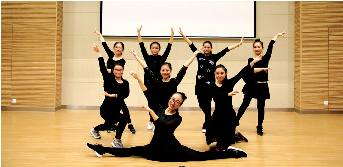
青春靓丽的“美女教团”