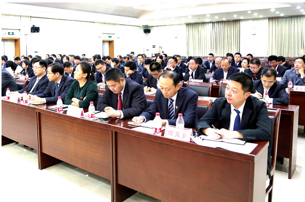
新郑市政府召开全体(扩大)会议

10月17日,新郑市政府召开全体(扩大)会议,回顾总结今年以来各项工作开展情况,分析研判新郑市经济社会发展中面临的困难和问题,对四季度工作进行再部署、再加压、再鼓劲。市长马志峰要求,全市各级各部门进一步紧盯目标,理清思路,强化措施、狠抓落实,全力以赴攻坚冲刺,确保全年目标任务圆满完成。