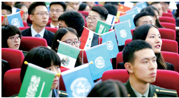
参加模拟大会的师生

本报讯 昨日下午,第十三届中国模拟联合国大会在解放军信息工程大学开幕。在接下来的这个周末,来自全国120余所高校的近500名师生,将化身各个国家的外交官,按照联合国的议事程序及相关国际准则参与“联合国会议”,开展磋商讨论。联合国秘书长潘基文发来贺信,并呼吁全球优秀青年一同建设全人类的美好明天。