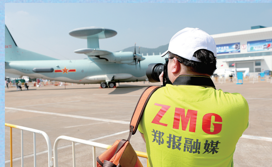
郑报融媒记者现场“直击”新机型

其实,军迷心目中,本届航展应该还有一个“20”出现,那就是“直-20”。可惜,这种未来将为中国陆军插上翅膀的神秘机型,目前还是神龙见首不见尾。