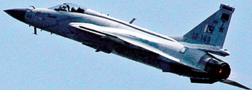
枭龙低空高速通场 撕裂空气