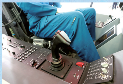
传说中的四代战机座舱