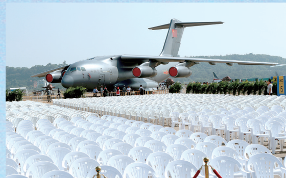
运-20静卧在航展静态展示区