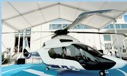
直升机里的“劳斯莱斯”

第十一届中国(珠海)航展今天拉开帷幕,郑报融媒资深军迷记者提前进入展览现场,为你打探独家“军事机密”。郑报融媒记者 朱建明 海宁 珠海报道