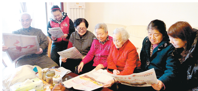
家庭党校,送学上门