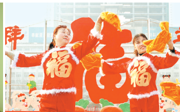
文化活动丰富多彩