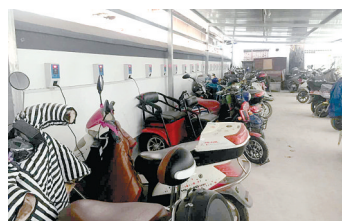
智能电动车棚全覆盖