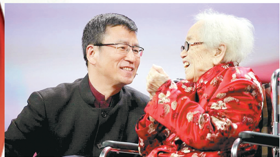
2013年感动中国人物——胡佩兰