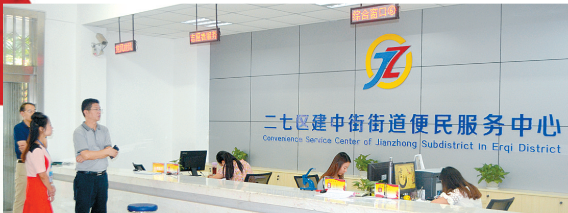
升级改造后的便民服务中心