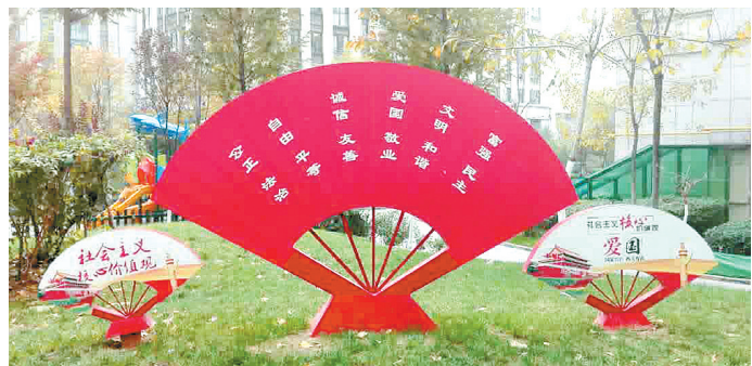
社会主义核心价值观主题社区