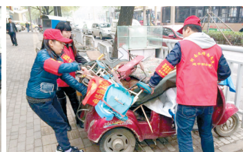
志愿者参与城市精细化管理