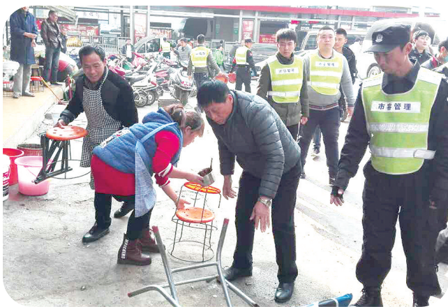
一马路街道清理占道经营