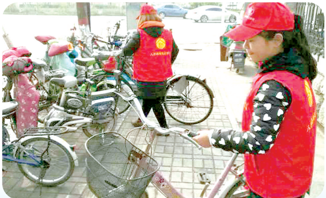
人和路街道志愿者整治乱停乱放非机动车辆