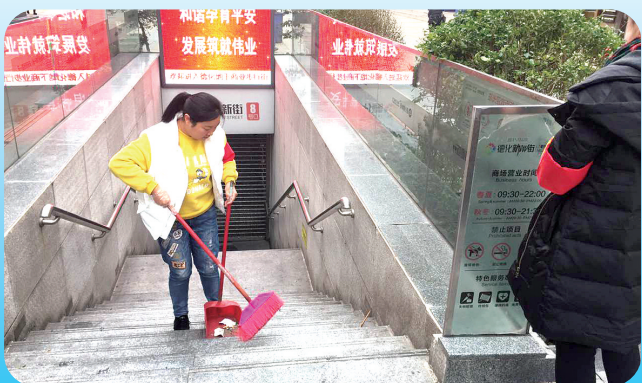
德化街街道周末时间走上街头清扫垃圾