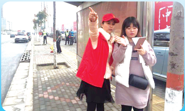
人和路街道志愿者为市民指路