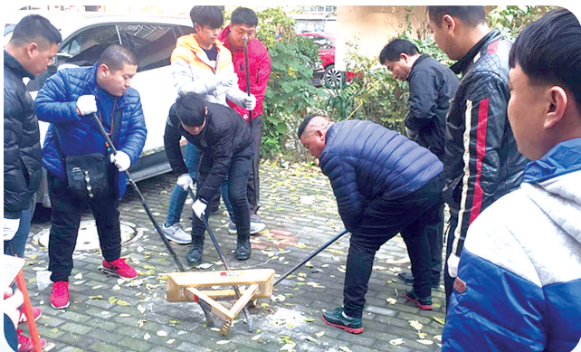
福华街街道拆除地锁