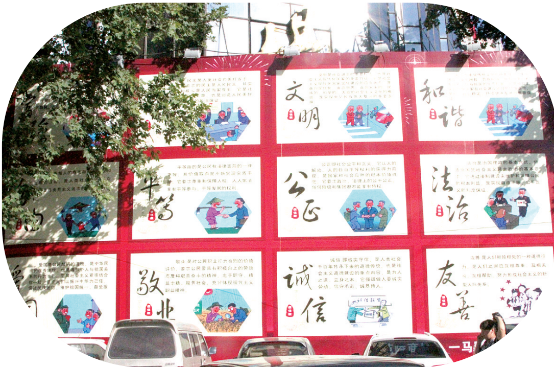
一马路街道的社会主义核心价值观宣传展板