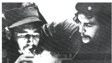
卡斯特罗喜欢雪茄,旁边是他的战友大名鼎鼎的切·格瓦拉