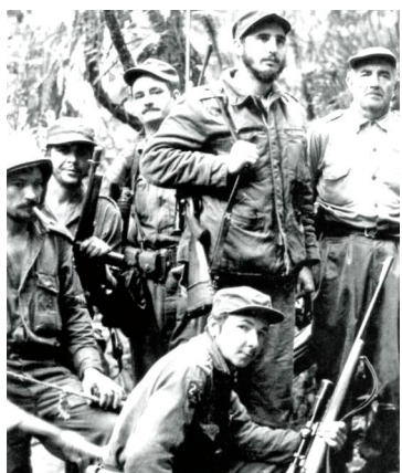
劳尔·卡斯特罗(前)、菲德尔·卡斯特罗(右二)和切·格瓦拉(左二)等1958年开展游击战争