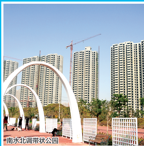
南水北调带状公园

2016年1~11月,累计发放低保金及各类临时补贴共计1159.67万元。完善了“四个一”社会救助体系,2016年共对2152户困难群众进行了帮扶救助。