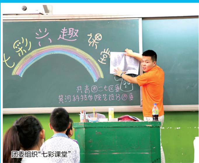
团委组织“七彩课堂”