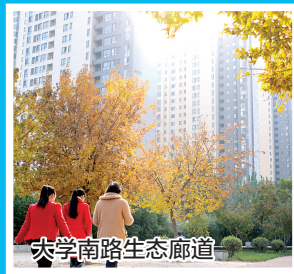
大学南路生态廊道