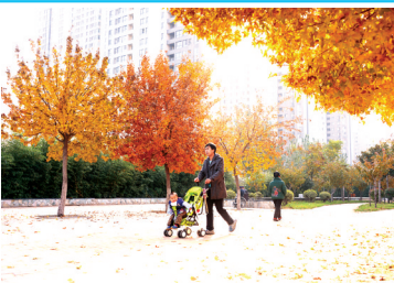
大学南路生态廊道环境优美