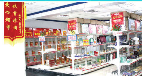
爱心捐赠救助互助站物品齐全