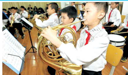
二七区艺术小学管乐社团在专业教室排练