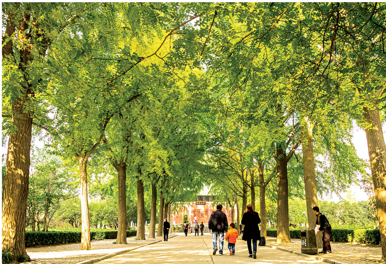
辖区群众幸福指数逐步提高

2016年即将过去,回顾这一年,二七区的民生实事进展如何呢?2016年,二七区加大民生事业投入,全区实现城镇新增就业人员 23695人 ,共分配公共租赁住房 2000余套 ,累计发放低保金及各类临时补贴共计 1159.67万元 ……让辖区群众享受到全方位的民生红利。