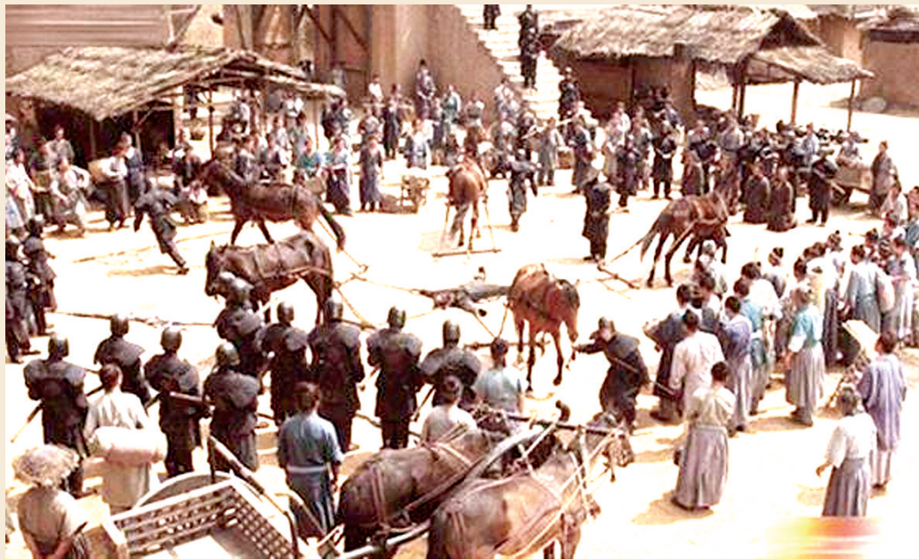
电视剧中演绎的五马分尸场景