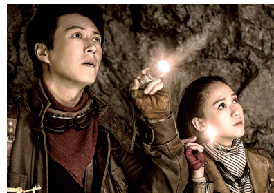
靳东、陈乔恩联手“下墓探险”

由靳东、陈乔恩等主演的网剧《鬼吹灯之精绝古城》已在腾讯视频播出6集,没有廉价敷衍的特效、狗血满满的套路,该剧在还原原著和制作上保持了不错的水准。而三集就“下墓探险”的紧凑结构,也让灯丝儿们(原著粉)吃了一颗定心丸。据统计,目前总播放量已突破2.8亿,豆瓣评分为8.6分。