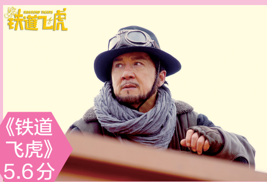
《铁道 飞虎》 5.6分