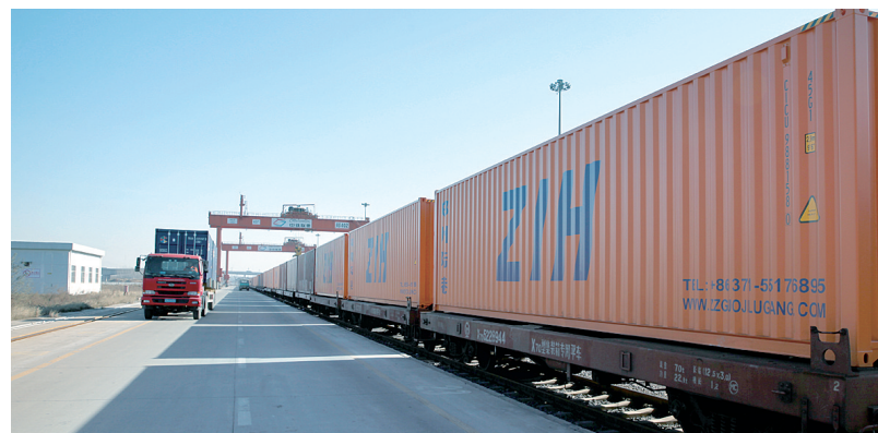
待发的中欧班列