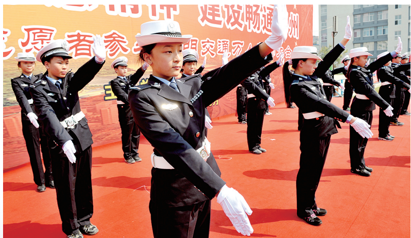
文明交通从娃娃抓起