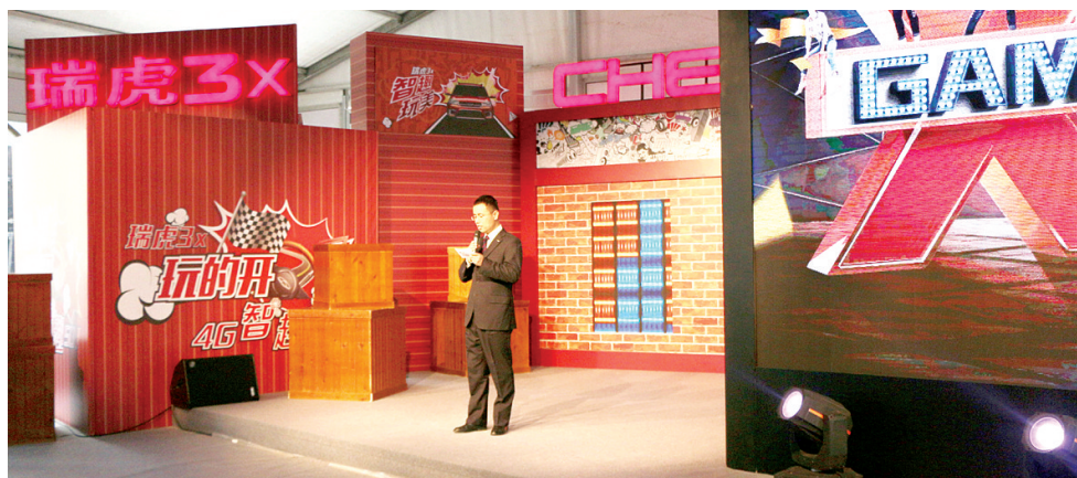
奇瑞汽车相关领导致开场词

12月24日~25日,由奇瑞汽车为其家族新成员——瑞虎3x举办的“X-Game嘉年华”区域发布会在郑州成功举办。本次“X-Game嘉年华”的举办进一步拉近了奇瑞品牌与人们的距离,让用户直观地感受到了奇瑞“自主创新”这一品牌的发展战略核心。谢宽