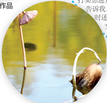
学生镜头下的残荷