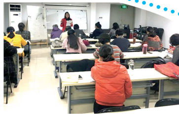
有序活跃的英语课