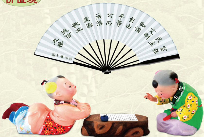
泥人张彩塑 王润棠作