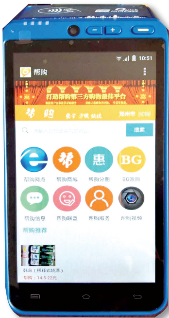
郑州帮迅操作平台展示

他忍痛割爱放弃了记者行业,放弃了教育公司、农业公司和金融公司。最后他选择了互联网行业,太多的经历给了他构建产业互联网(BG生态系统)的基石和远大构想。