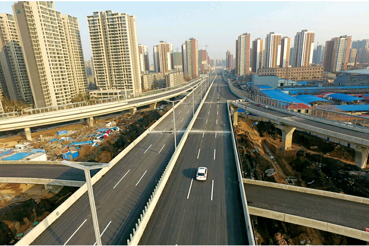
农业路一西三环互通立交,3月前8条匝道可全部互通