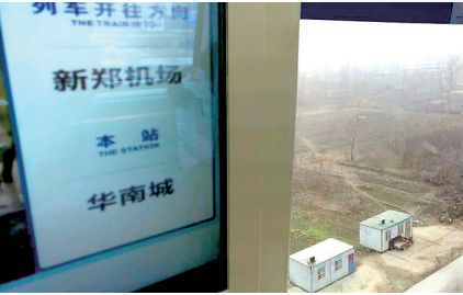
开通初期大小交路套跑运行