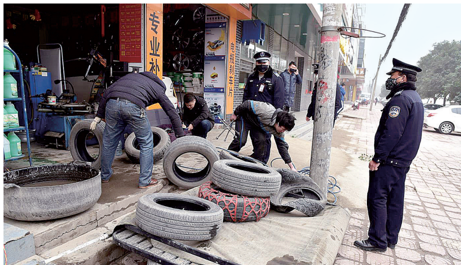
国基路上,一轮胎销售店将门外的物品往店里搬

本报讯 普庆路一家汽修店,长时间占道经营并有不规范喷漆现象。昨日,辖区办事处联合城管执法部门,给该店下达了责令整改通知书,并将烤漆车间贴上封条。随后,另外两个占道经营汽修店面,占道经营情况得到了整改。郑报融媒记者 王军方 文/图