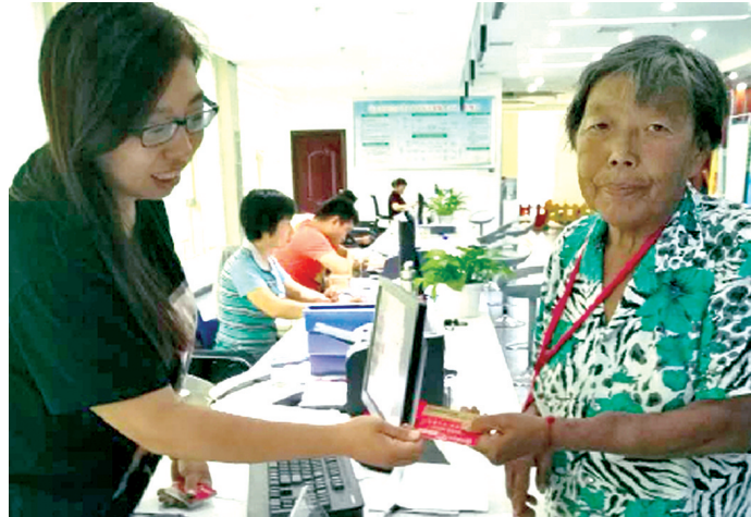
白鸽社区去年9月份为困难群众发放领物卡(资料图)