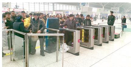
乘客有序地排队进站