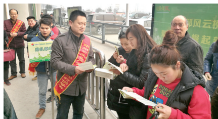
党员志愿者给乘客发放公交线路宣传彩页