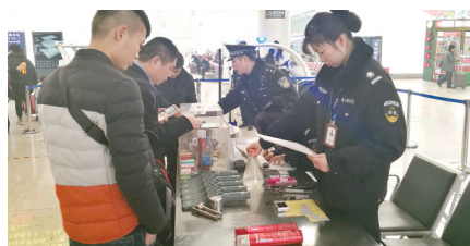
工作人员严查易燃易爆品