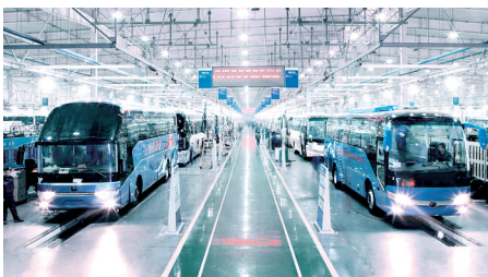
郑州宇通节能与新能源客车生产车间

引进中铁重大装备制造科技产业园,开工通号产业园等项目10个,力争乾德电子、竹林松大等8个项目竣工投产,并推动宇通重工由单纯的生产型企业向城市环卫服务商转变,促成海尔模块化配套气体及注塑项目投产。