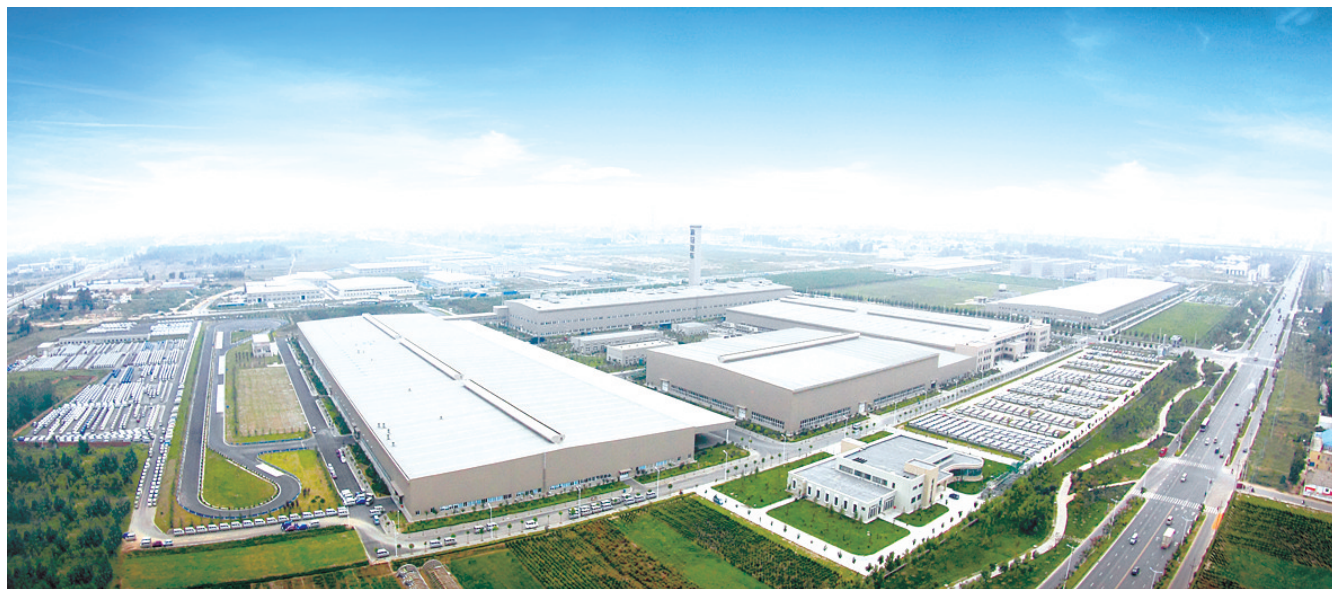
海马(郑州)汽车有限公司鸟瞰图

今年,经开区将建设全国具有重要影响力的新能源汽车研发和整车生产基地,形成集研发、生产、销售、服务于一体的完整汽车产业链,力争全年汽车产量突破60万辆,零部件企业达120家,汽车及零部件产业主营业务收入突破1000亿元,率先实现千亿级目标。