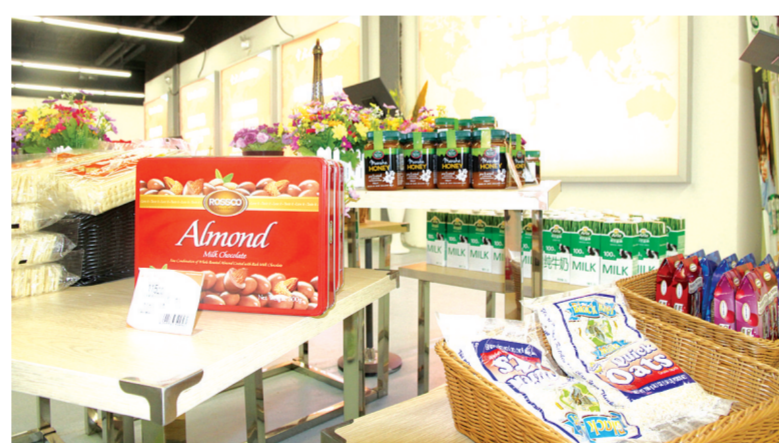
中大门琳琅满目的商品