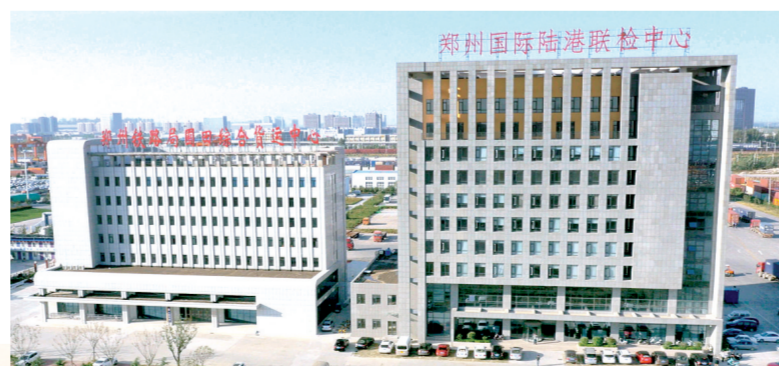
郑州国际陆港联检中心