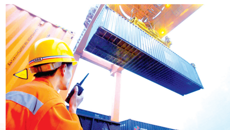
国际陆港货物起卸中