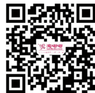
扫二维码 抢购情人节鲜花

详情可以登录www.taodudu.com 或致电4000371775咨询，或用手机扫描二维码直接预定。 郑报融媒记者 廖谦