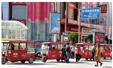
钱塘路上仍有不少拉客三轮车。