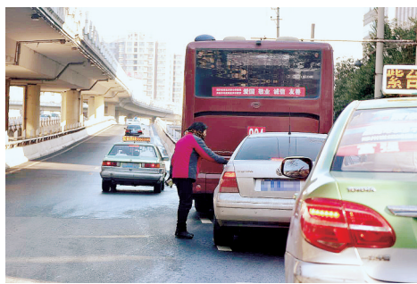
河医立交下，一女子招徕停车。

河医转盘东边的建设东路上，依然有乱停放的机动车。南侧快车道上，也停放了不少电动车和自行车。