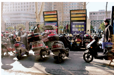
河医转盘东边公交站牌处停了不少电动车。