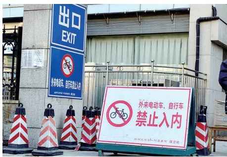
郑大一附院门口的牌子。