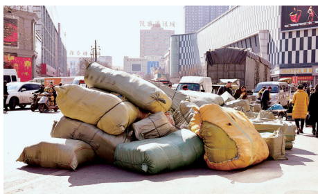
钱塘路上堆着的货物。