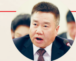
张瀛岑 全国人大代表、天伦集团 董事长

为加快建设高层次科技人才队伍,郑州将大力实施“智汇郑州·1125聚才计划”,力争今年引进创新创业领军人才和高层次创新创业紧缺人才200名,领军型科技创新创业团队20个,培育科技企业家40名,集聚“两院”院士、“千人计划”、“万人计划”等顶尖人才20名。