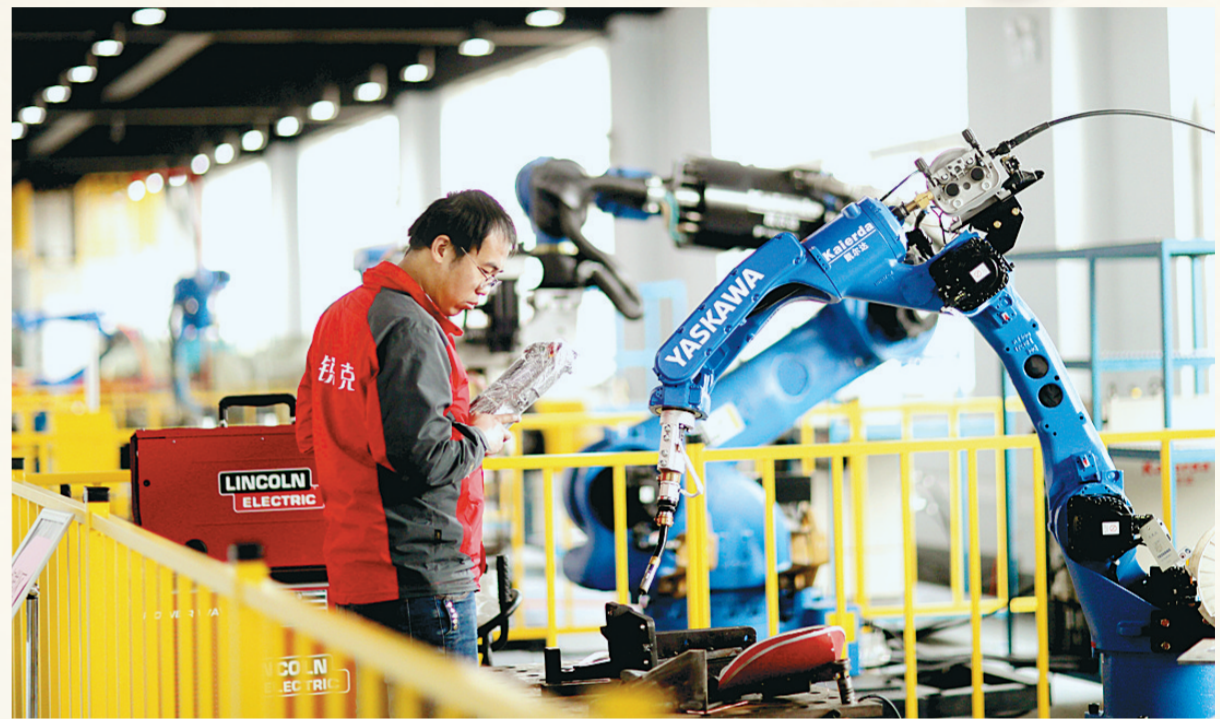
洛阳高新区美锐克智能科技公司机器人车间

今年,是郑洛新国家自主创新示范区建设突破之年。洛阳紧紧抓住建设国家自主创新示范区这一“龙头”,围绕打好“四张牌”排兵布阵,全面推进科技创新,加速构建良好政策环境,激活发展第一动能,奏响古都创新春之声。《洛阳晚报》记者 李砺瑾 潘立阁/文