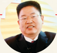
宋丰强 全国政协委员、河南绿色中原现代农业集团董事长

在示范区建设资金投入上,引进市场机制,加大科技创新投入,保障示范区建设资金需求。