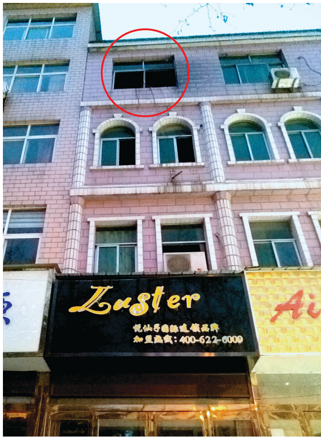
图中红圈处为发生火灾住户家的窗口