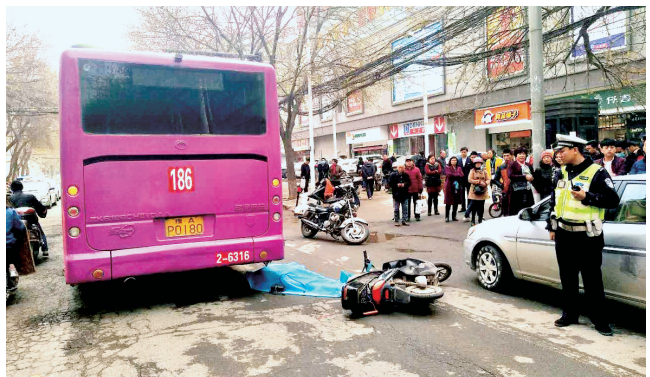
事故现场 资料图片