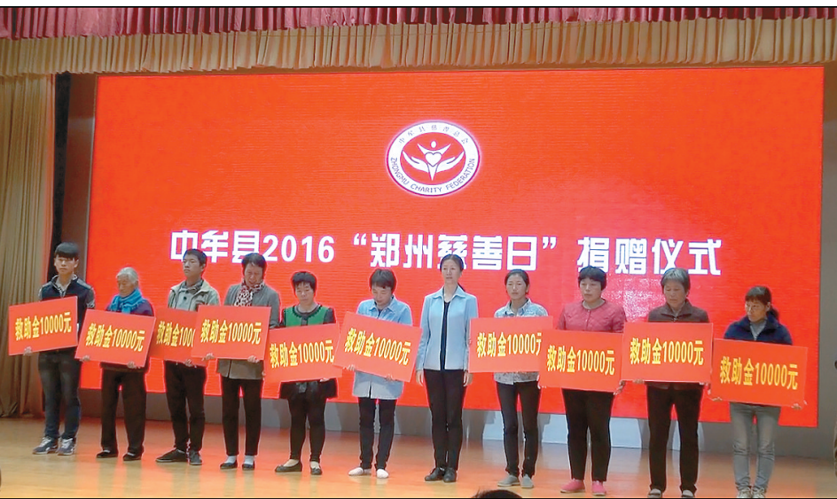
“郑州慈善日”中牟在行动

“十三五”大幕已经正式拉开,民政事业发展任重道远。中牟县委、县政府将以服务大局为根本,认真践行“以民为本、为民解困、为民服务”的工作宗旨,时刻把困难群众的安危冷暖挂在心上,扎实为群众排忧解难,用真情搭起一座党委政府和人民群众的连心桥,全力保障人民群众最关心、最直接、最现实的利益。